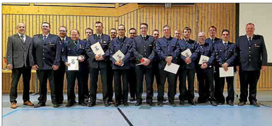
Die Feuerwehrmitglieder der Gesamtwehr Bad Liebenzell

21. - 22.09.2019 Feuerwehrtage Bad Liebenzell